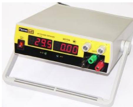
Рисунок 1. Фотография общего вида источников питания.

Фотография общего вида источников питания представлена на рис. 1. Схема пломбировки от несанкционированного доступа изображена на рис. 2.