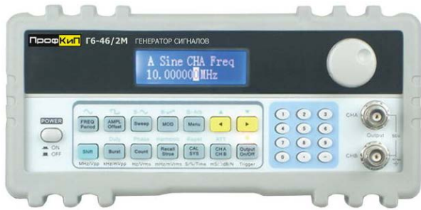
Генератор сигналов низкочастотный ПрофКип Г6-46/2М