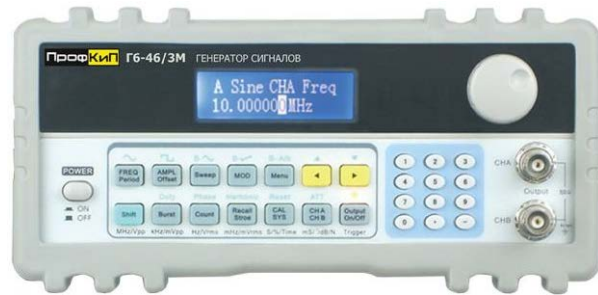
Генератор сигналов низкочастотный ПрофКип Г6-46/3М